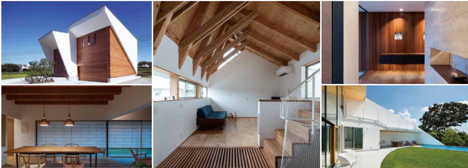
使用写真／(上段左)設計:佐藤正彦 / (左下)設計:加藤雅康 / (中央)設計:天久和則 / (右上)設計:岸研一 / (右下)設計:河内真菜

ARCHITECTS STUDIO JAPAN アーキテクト・スタジオ・ジャパンは 建築家の専門店です。 https://www.asj-net.com/