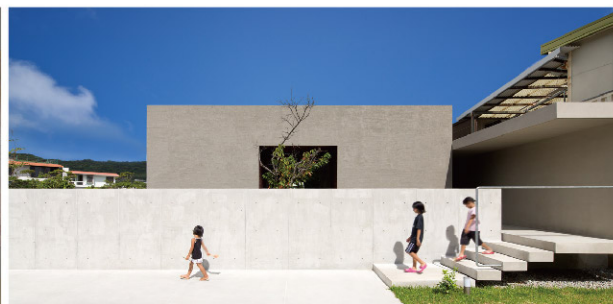
「南城の家」・「読谷の家」/ 設計: 松山哲勝 (株式会社松山建築設計室) 施工: ASJ 沖縄南スタジオ・ASJ 沖縄北スタジオ

お問い合わせは、ASJ東京東スタジオ ☎ 0120-70-3151 tel. 03-3675-4760